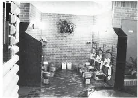
清潔で明るいことが最大のキーポイント

サウナ室は高温ですので、サウナ室の炭化は激しく、壁面の照明器具等がゆるんで落ちたり、電線がショートしたりということもあり得ることで、そのためにお客様にケガをさせたり、あるいは失火の原因となったりすることがあります。 常に万全の配慮がなされているはずですが、改装を先手先手と実行してゆくのも、お客様へのサービスであり、営業政策の一つではないでしょうか。