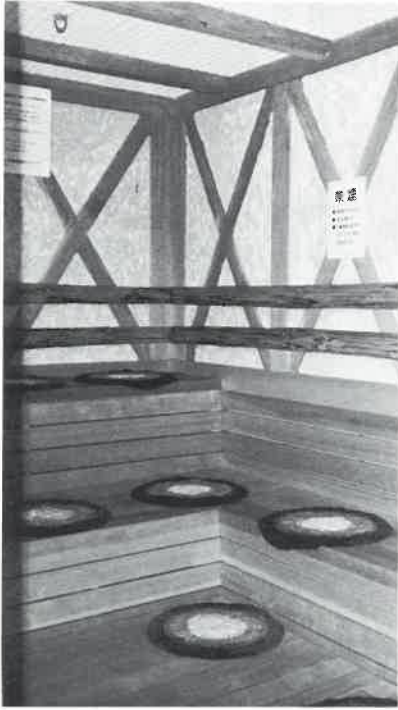
燃料の高騰、設備破損等をどこでカバーするか、値上げのタイミングはむずかしい。

値上げに対する抵抗を少しでも緩和するためには、サービスを一層充実して『感じの良いお店』にすることは大切なことです。おそれなくお客様は、多少料金は高くても、清潔で明るいサウナをお選びになるにちがいません。