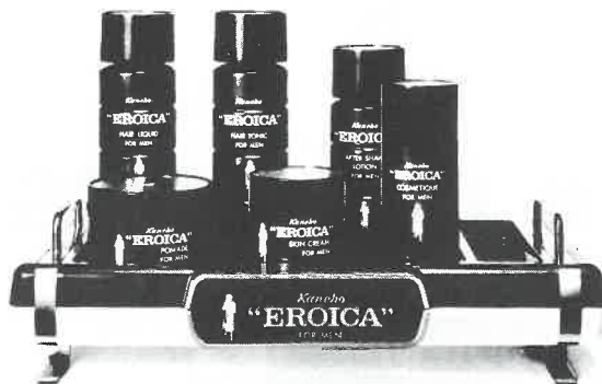
紳士用化粧品エロイカシリーズ

エロイカのあの独特の清涼感とまるやかさ、 心にゆとりを生む気品ある香り。英雄は英雄 を知るとか。エロイカは、おたくのサウナに 一級のお客さまを呼ぶでしょう。